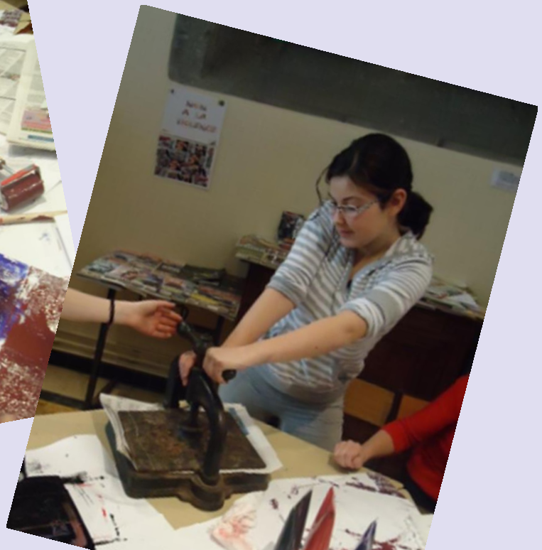
Appliquer la plaque gravée et encrée sur un beau papier avec une presse.