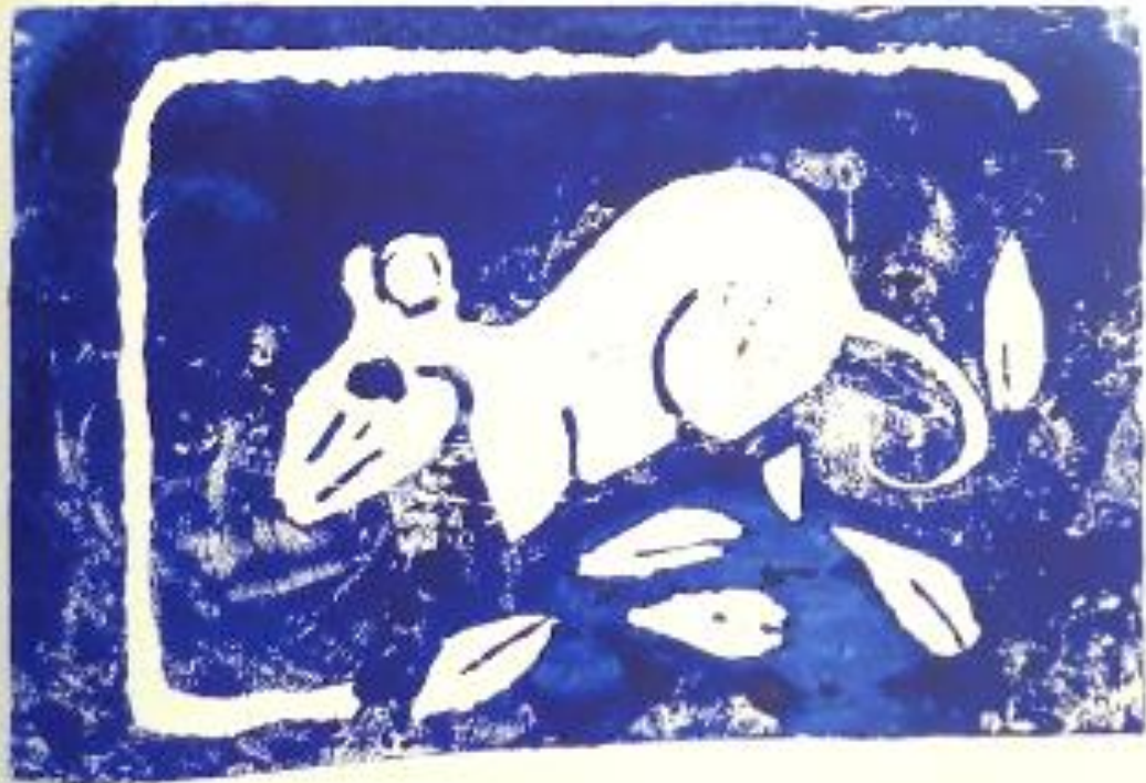
Le dessin imprimé