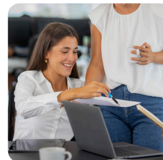
CAP Équipier Polyvalent du Commerce