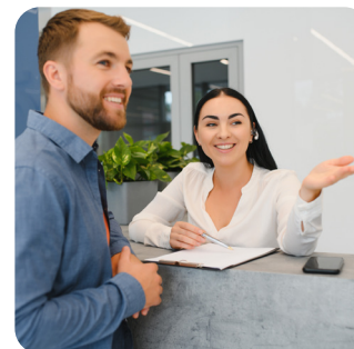
BAC PRO Métiers de l'Accueil