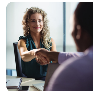
BAC PRO Métiers du Commerce et de la Vente